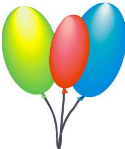
Рис. 4. Применение заливки к фигуре